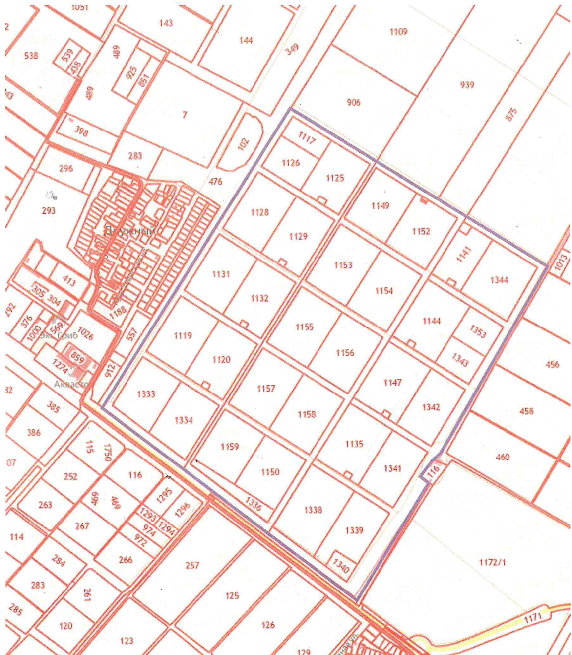
Схема границ проектирования